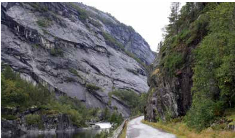
Fra sør: Her ser vi hvor smalt det er i skaret som skulle stenges.