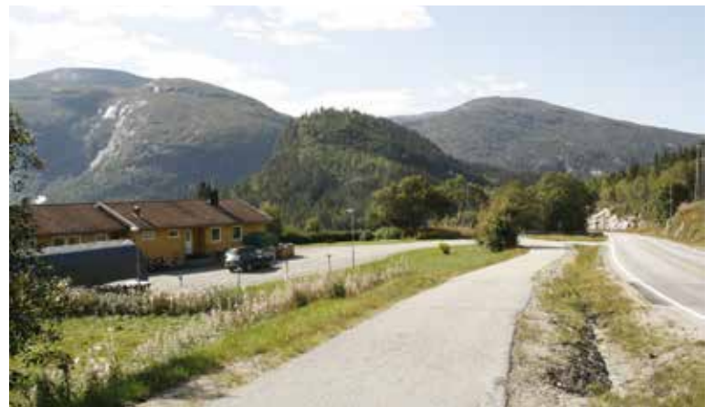
Hit: Nøyaktig til dette huset i Byklebakkene, like ved riksvei sør for Bykle kyrkje, ville vannet fra Bykildammen gått.