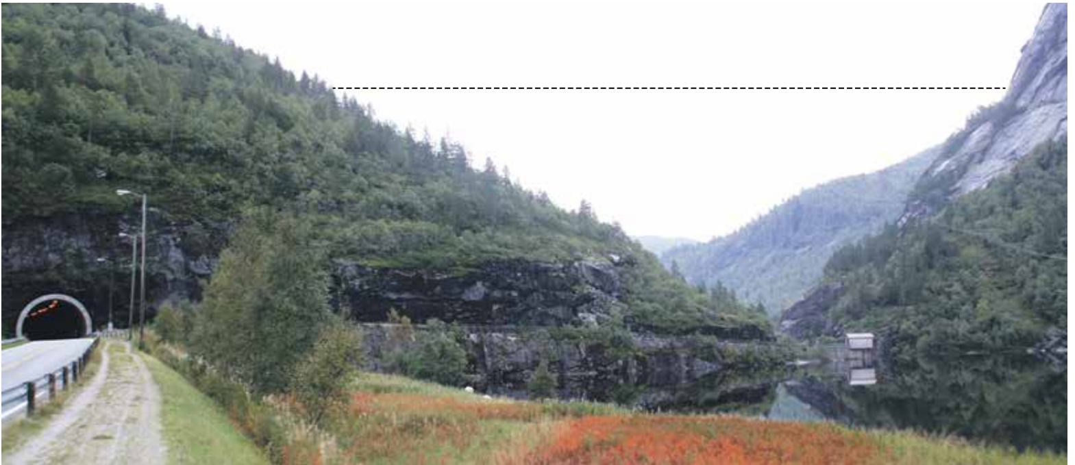
Fra nord: Slik ser skaret ved Byklestigen ut fra nord. Den gamle riksveien ser vi til høyre for tunnelen. Dammen ville kommet i skaret til høyre, der vi har forsøkt å antyde høyden med stiplede linje.